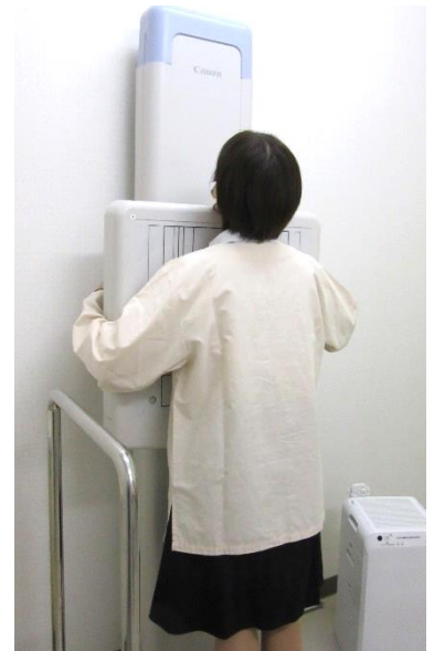
▲胸部レントゲン撮影