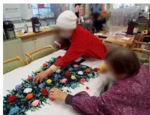
▲クリスマスイベント