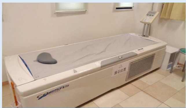
ウォーターベッド

リハビリテーション治療は手術の後や怪我だけではなく、肩（肩こり、五十肩）、腰、膝などの痛みを伴う症状の方、交通事故外傷などでも受ける事ができます。