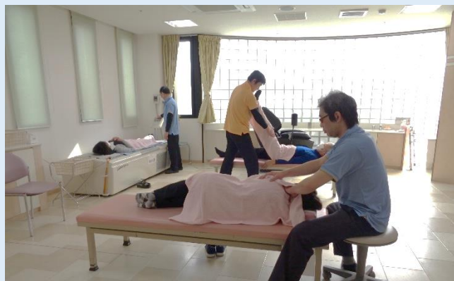
リハビリ・マッサージ室

ぜひ一度、当院の整形外科リハビリテーションをご利用ください。皆さまの痛みを少しでも和らげ、仕事や日常生活を楽に過ごせるよう努力してまいります。