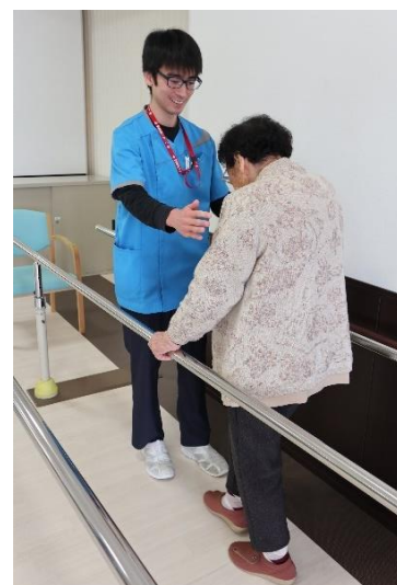
▲理学療法士によるリハビリ