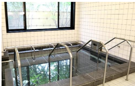
▲一般浴室(天然温泉)