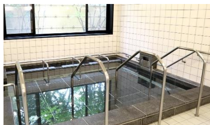
▲一般浴室（天然温泉）

川場温泉（天然温泉）を使用した一般浴室はとてん温まりリラックスできると好評です。