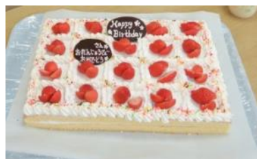
▲お誕生日会の手作りケーキ