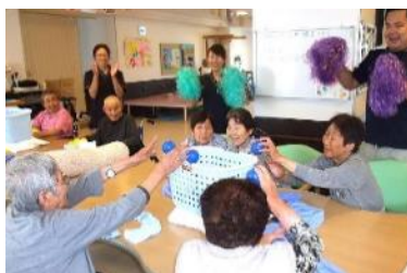
▲レクリエーション