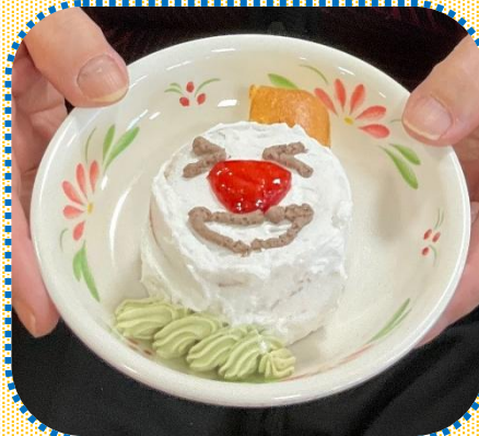
スノーマンケーキ

焼いたケーキにクリームやチョコペンで雪だるまの顔を描きました。個性豊かなケーキになりました。