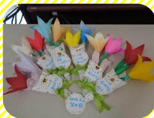
利用者さまの作品